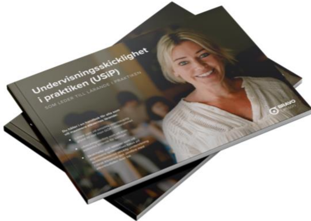
Observationsunderlaget och boken Undervisningsskicklighet i praktiken (USiP)